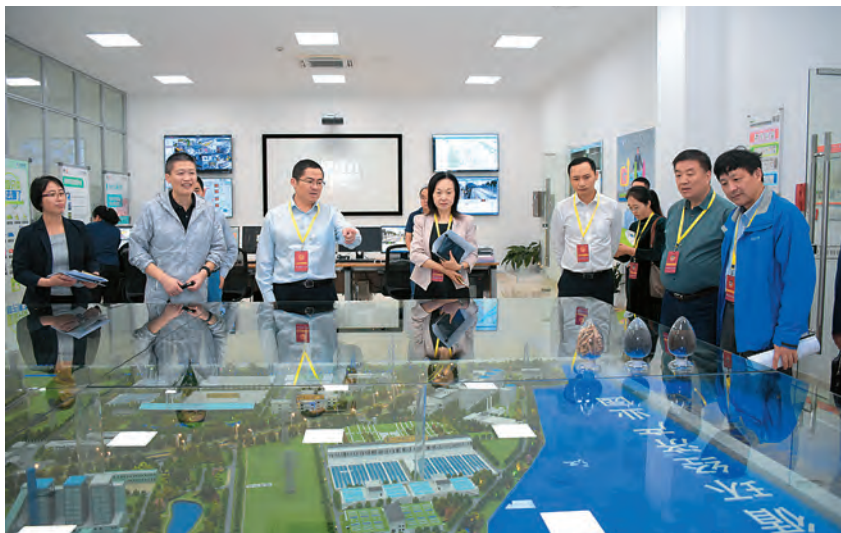
2020年10月14日,园区人大工委组织人大代表监督视察水环境保护治理工作

【执法检查工作】 2020年,园区人大工委以加强民主法治建设为己任,开展执法检查,促进法律法规有效实施。先后对《中华人民共和国野生动物保护法》《中华人民共和国安全生产法》《中华人民共和国土壤污染防治法》《中华人民共和国河道管理条例》等法律法规贯彻实施情况开展执法检查。6月28日,组织开展《中华人民共和国野生动物保护法》执法检查,查看湖东邻里中心菜场、莲花农贸市场等场所,加强行业监管,发动全民参与,为野生动物保护提供有力法治保障。7月7—8日和12月9日,分别组织开展安全生产执法检查,深入建筑工地、商业综合体和重点安全企业进行实地检查,听取相关单位关于安全生产工作情况汇报,督促加强企业安全生产意识、狠抓风险隐患排查、强化监管责任落实。8月18日,组织开展《中华人民共和国土壤污染防治法》执法检查,查看金鸡湖学校苏桐路校区和苏州三星电子有限公司,用法治力量保护生态环境,依法打好净土保卫战。10月19日,组织开展《苏州市河道管理条例》执法检查,查看水利实施管理中心等地,督促巩固和提升水环境质量。