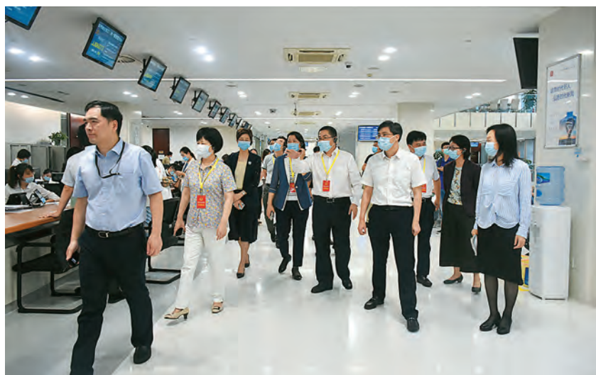
2020年7月15日, 园区人大工委组织代表开展营商环境专题调研 (园区新闻中心 供稿)

【营商环境工作调研】 2020年7—11月, 园区人大工委根据市人大常委会“代表评营商, 助力最舒心”专项工作部署, 组织各级代表开展形式多样的营商环境工作调研活动, 组织人大代表、企业家代表以及部分部委办局负责人进行座谈交流, 发动园区222名各级代表参与填写调研问卷, 围绕行政审批、企业融资、减