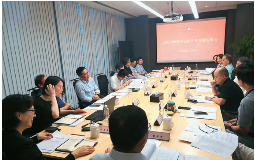
2020年9月14日,园区政协集成电路产业专题协商会召开 (园区人大工委 供稿)

【民主监督】 2020年7月7—8日,园区人大工委会同园区安委会、苏州工业园区高端制造与国际贸易区(简称