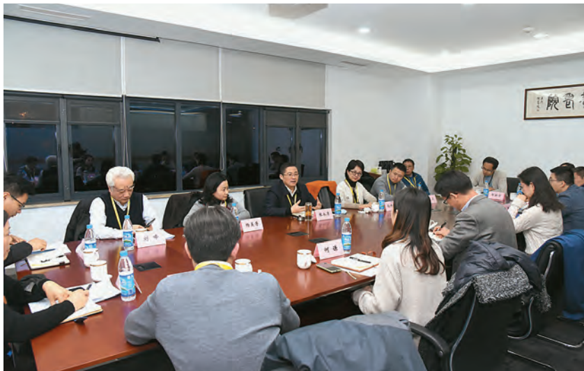
2020年12月16日, 园区人大工委组织代表调研养老事业发展工作 (园区新闻中心 供稿)

【代表意见建议办理工作】 2020年, 在苏州市第十六届人民代表大会第三次会议期间, 园区代表团提出建议意见9件。7月23日, 园区人大工委组织代表对市人代会期间转交园区办理的10件市人大代表建议进行专题督办, 通过实地察看、汇报座谈, 了解代表建议办理进展情况, 同时加大统筹协调、合力破解的力度, 建议办结率和满意率100%。