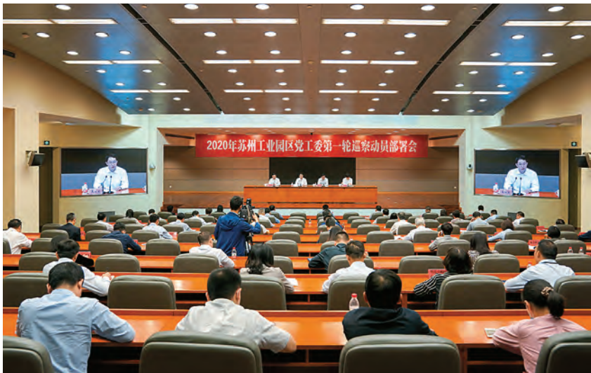
2020年5月12日,2020年苏州工业园区党工委第一轮巡察动员部署会召开

【政治巡察】 2020年,园区纪工委监察工委在市委统筹推进下,落实园区党工委主体责任,坚守政治巡察定位,持续深化政治巡察,提升巡察监督质效,发挥全面从严治党利剑作用,高质量实现巡察全覆盖。制定《2020—