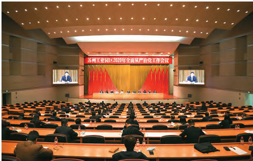
2020年4月24日,苏州工业园区2020年全面从严治党工作会议召开 (园区纪工委监察工委 供稿)

【纪检队伍建设】 2020年,园区纪工委监察工委落实全员培训要求,分层分类、按需施教,开设“短平快”的纪检实务讲堂;突出政治建设,组织赴延安锻炼党性,汲取革命先辈精神力量和经验智慧,全年培训10批次319人次。巩固提升“双向挂钩实践锻炼”工作成效,先后组织5批次59名基层和园区纪工委监察工委机关干部参加双向挂钩实践锻炼,提升专兼职纪检监察干部实战水平和群众工作能力。细化落实纪检监察工作双重领导体制,推动纪检监察干部任职交流,选优配强基层纪检干部。严格按照权限、规定、程序,依规依纪依法开展工作,常态化组织开展“走读式”谈话安全检查。认真贯彻江苏纪检监察干部“八严禁”,全面落实个人有关事项申报,开展专兼职纪检监察干部谈心谈话,引导纪检监察干部做到忠诚干净担当。(柴瑞)