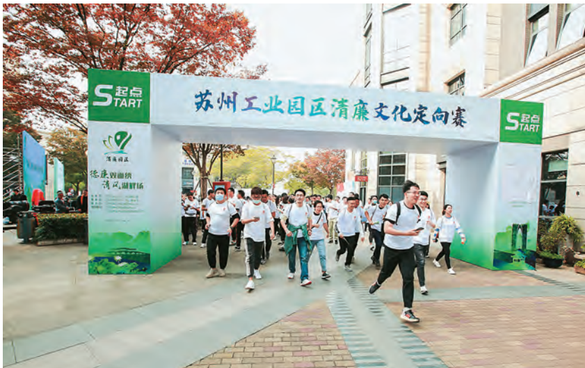
2020年11月1日,苏州工业园区清廉文化定向赛在李公堤举行

含的正气廉洁、忠诚担当、为民务实、尚俭戒奢等价值理念,以优良政风社风带动民风社风,“三不”一体打造“清廉园区”金字招牌。常态化开展党章党规党纪教育特别是警示教育,充分发挥查办案件治本功能,坚持一案一剖析、一案一警示。制定《关于党工委班子开展警示教育的建议方案》,编制《园区近年发生的违纪违法典型案例汇编》,推动各级党组织联系典型案例召开专题民主生活会,讲授纪律教育党课,向相关党委主要负责人通报下属公职人员违纪违法案件,分级分类开展警示教育,压紧压实管党治党责任。年内23篇报道被《人民日报》《中国纪检监察报》《新华日报》、“学习强国”平台、中央纪委国家监委网站等省级以上媒体采用。