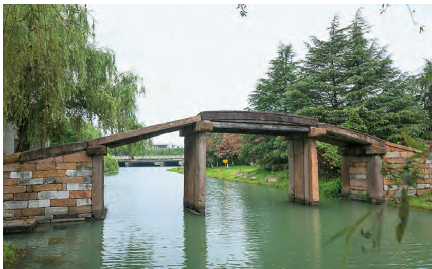
江苏省文物保护单位永安桥

【人口】 至2020年底,园区常住人口113.39万人。户籍人口594862人,增加25195人,增长4.42%;流动人口755298人,减少21787人,下降2.8%。全年出生人口6590人,增加61人,出生率11.08‰;死亡人口2310人,增加458人,死亡率3.88‰。全区人口自然增长率7.2‰。湖西社区、湖东社区、东沙湖社区、月亮湾社区人口自然增长率分别为4.89‰、11.94‰、18.49‰、11.95‰,娄葑街道、唯亭街