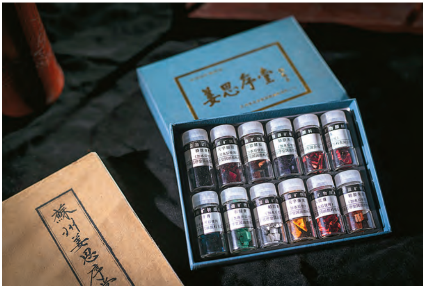
国家级非物质文化遗产姜思序堂国画颜料制作技艺——5克12色颜料 (园区宣传和统战部 供稿)

草鞋山遗址。 位于园区阳澄湖大道与唯胜路交叉口,毗邻华谊兄弟电影世界。该遗址是新石器时代文化遗址(距今约6000年),经过多次考古发掘研究,发现其丰富的文化内涵和考古价值。它是江南地区迄今为止所发现的文化发展序列保存最完整的遗址,发现了迄今中国最早有灌溉系统的古水稻田,出土了迄今所知中国年代最早的纺织品实物,首次在中国史前墓葬中出土玉器。2013年,入选第七批全国重点文物保护单位。2014年,江苏省政府划定草鞋山遗址保护范围为东起东港河以西,西至司马泾河(原西港河)以东,北起阳澄湖大道南侧,南至面店河北岸,约18.33万平方米;建设控制地带为东起东港河东岸,西至司马泾河(原西港河)西岸,北起阳澄湖大道北侧,南至横泾港南岸,约24.55万平方米。2018年10月,江苏省政府通过《草鞋山遗址保护规划》。2020年,完成遗址全面考古勘探并通过验收。向国家文物局申报草鞋山遗址保护利用设施建设项目,打造“行走在遗址间”主题现场展示项目,并获批。