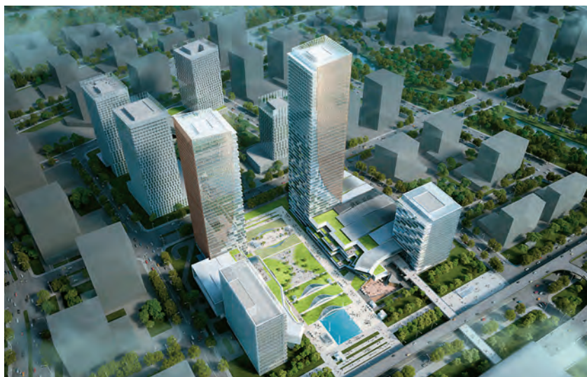
苏州自贸商务中心效果图

【苏州自贸商务中心开工建设】 2020年10月19日,苏州自贸商务中心开工建设。作为苏州自贸片区的重要地标,该项目位于园区企业总部基地