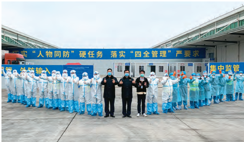
2020年11月23日，园区进口冷链食品集中监管仓投入使用

全示范区”。加强监管信息化建设，开发上线园区食品安全综合协调监管系统，服务于园区“一级政府、两级管理、三级网络”的食品安全体系，为食品安全网格化的精准定位提供技术支持。优化监管队伍结构，制定并下发《苏州工业园区食品安全协管员、信息员聘用管理及考核办法(试行)》，打造市场监督管理人员、食品安全协管员、信息员“三员”食品安全监管队伍，推动上下齐抓共管形成合力。狠抓监管工作成效，严格按照“四个最严”要求，加强食品药品安全监管。全年出动执法人员1.76万人次，检查食品药品生产经营使用单位1.7万余户次，开展专项检查45次。开展法定检测5576批次，年度食品安全抽检率6.81批次/千人，合格率98.33%。开展食品安全快检4323批次，合格率98.5%。立案查处一般程序案件138起，罚没金额692.24万元。推进新冠肺炎疫情防控，打好防控“主动仗”，做好“六稳”“六保”工作。出台《社会餐饮单位防控新型冠状病毒疫情提示》，指导督促餐饮单位、冷库等重点场所加强新冠肺炎疫情防控工作，助力区内集体用餐配送单位、连锁餐饮单位等复工复产，确保市场供应和食品安全平稳有序。完成园区进口冷链食品集中监管仓建设，做好集中监管