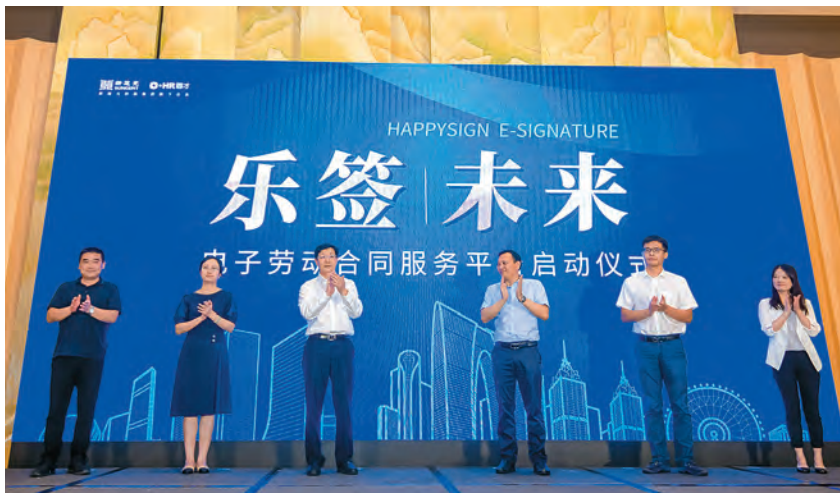
2020年9月11日,乐签电子劳动合同服务平台启动仪式举行

【苏州新时代文体会展集团有限公司】 2020年,苏州新时代文体会展集团有限公司(简称新时代集团)在半年主营业务无法正常开展和赛场、影院、剧院全年限流的情况下,取得明显好