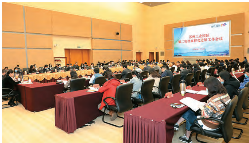
2020年4月3日,苏州工业园区第二轮档案移交进馆工作会议召开 (园区档案管理中心 供稿)

【概况】 2020年,园区机关事务管理中心履行后勤服务保障职能,开展设备设施巡检114万余台次,故障修复3000余台次,管控登记外来人员41万余人次,完成地毯清洁、地坪清洗、石材养护等70余万平方米,蚊虫消杀约40万平方米。日均供餐2200余人次,提供食堂净菜预定、节假日套餐服务5360余批次。围绕全球智博会等重大会议和重要活动,做好各项服务保障工作,全年保障会议服务1560余批5.6万余人次,接待联络780余批2.3万余人次,出车1.4万余次,安全行驶43万余千米。介入市民服务中心建设项目早期工作,承担老干部活动中心重建等代建职责。完成办公集中区电梯、场所及空气系统的防疫消毒5.2万余次,协助园区新冠肺炎疫情防控指挥部合规发放防疫物资263万余件。参与编写苏州市地方标准《党政机关集中办公区物业服务与管理规范》(DB3205/T 1012-2021)、团体标准《新型冠状病毒肺炎疫情防控期间公共建筑空调通风系统运行管理技术指南》(T/CPMI 009-2020)等指